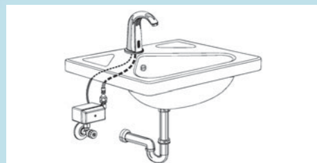
Kalt- oder vorgemischtes Wasser