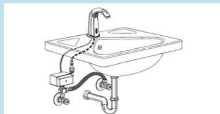
Zentrale Wasserversorgung kalt/warm Festtemperatur/Verbrühschutz